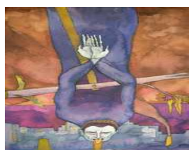
Ugo Pierri. Diario di un anarchico istituzionale