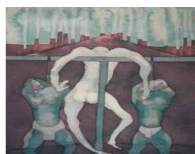
Ugo Pierri. Diario di un anarchico istituzionale