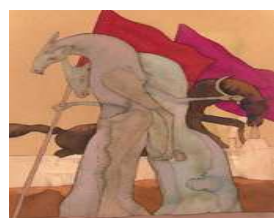
Ugo Pierri. Diario di un anarchico istituzionale