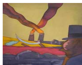
Ugo Pierri. Diario di un anarchico istituzionale